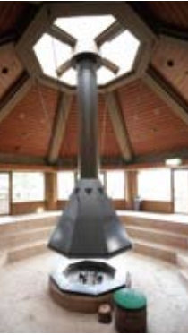
①交流の場として使用される火の間（2,000円／2時間）。②かわせみの湯。③健康浴パーデ。④宿泊室。

●「金沢八景」駅から神奈中バス「森の家前」下車、徒歩10分。横浜市栄区上郷町1499-1／Tel.045-895-5151（9時～17時）