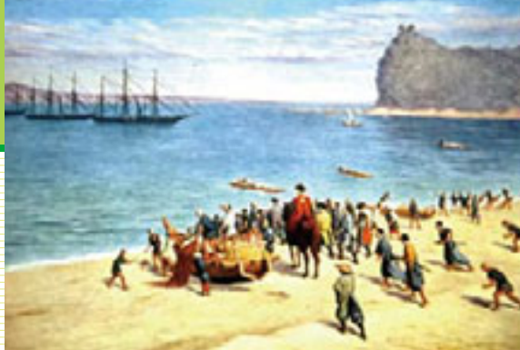
「黒船の来航」井上啓次画(印刷)楠山永雄氏蔵