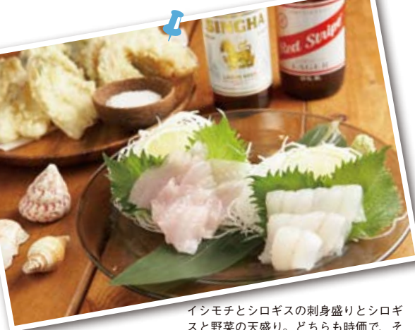
イシモチとシロギスの刺身盛りとシロギスと野菜の天盛り。どちらも時価で、その日獲れた魚によってメニューが変わる。

⑤龍華寺の本堂手前には「ボケ封じ観音」がある。⑥飾らず親しみやすい語り口の「荒川屋」の皆さん。