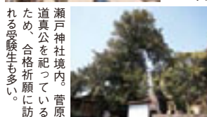
瀬戸神社境内。菅原道真公を祀っているため、合格祈願に訪れる受験生も多い。