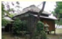
解体前の旧伊藤博文別邸。この辺りが横浜近郊の別荘地であったことを物語る貴重な建築物だ。

伊藤博文の別邸は野島公園内に位置し、横浜市指定有形文化財に登録されているが、現在、横浜市によって復元工事が進められている。横浜開港150周年で伊藤博文没後100年にあたる今年秋頃の完成予定だ。