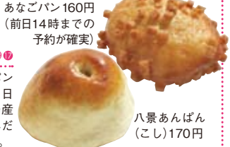
八景あんぱん (こし) 170円

●シーサイドライン「海の公園柴口」駅から徒歩6分。7時～19時、不定休。横浜市金沢区柴町345-86 / Tel.045-788-0520