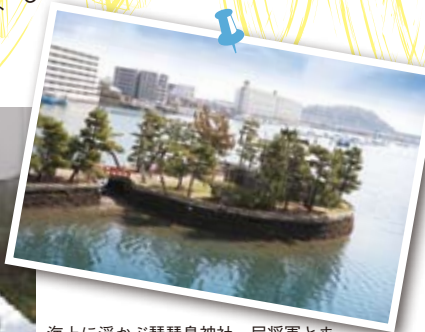
海上に浮かぶか琵琶島神社。尼將軍とまで呼ばれた北条政子にゆかりがあることから出世にご利益があるとされる。

荒川屋からさらに東へ進むと『憲法草創之碑』と刻まれた大きな石碑が現れる。かつて、多くの政治家や文化人が