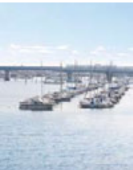
平潟湾に停泊しているヨット。セレブが集まるリゾート地の雰囲気?

風光明媚な景勝地として古くから知られた金沢八景。初夏の日差しを浴びながら、海に向かっていざ出発! 昔と今が交差する街の顔を探し求めて、ひと巡りしてみよう!