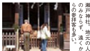
瀬戸神社。地元の人のみならず、遠くからの参拝客も多い。

瀬戸神社から海際の道を歩いていくと、釣り船屋の数の多さに気付かされる。そんな釣り船屋のひとつ『荒川屋』で話を聞くと「この辺りは魚影が濃く、釣れる魚の種類も豊富なので、初心者でも釣りやすい」といふ。最近では女性客も多いとか。また、こちらの店を営業しているそうだ。