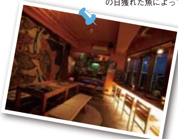
南国ムードあふれる Sand Fish店内。カクテルなど、ドリンクメニューも豊富。

⑥「荒川屋」の釣り客が釣り上げたばかりのシロギス。キラキラと輝くウロコが美しい。⑦海沿いの栈橋で、金沢八景の名産であるワカメを干している。